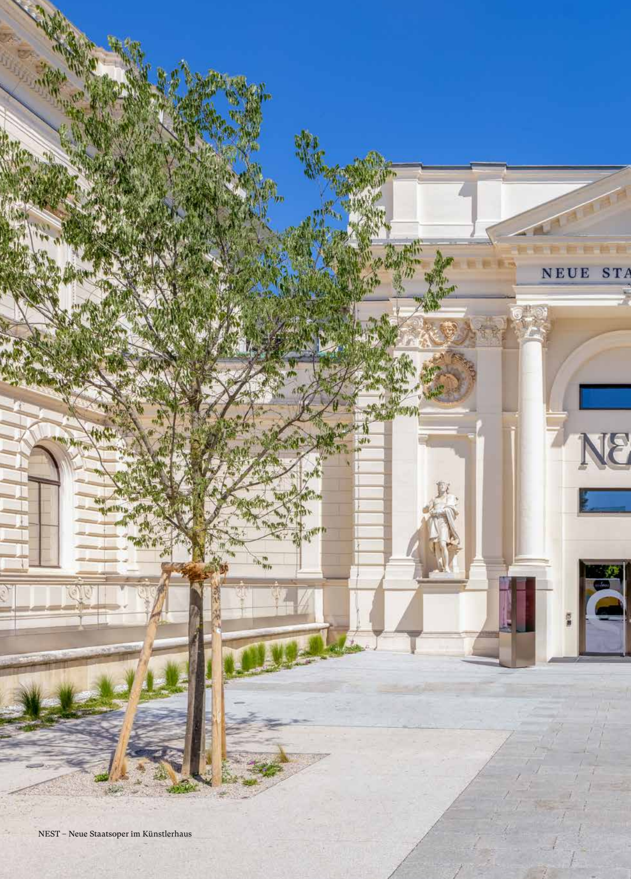
NEST – Neue Staatsoper im Künstlerhaus