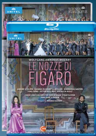
WOLFGANG AMADEUS MOZART LE NOZZE DI FIGARO conducted by Philippe Jordan staged by Barrie Kosky