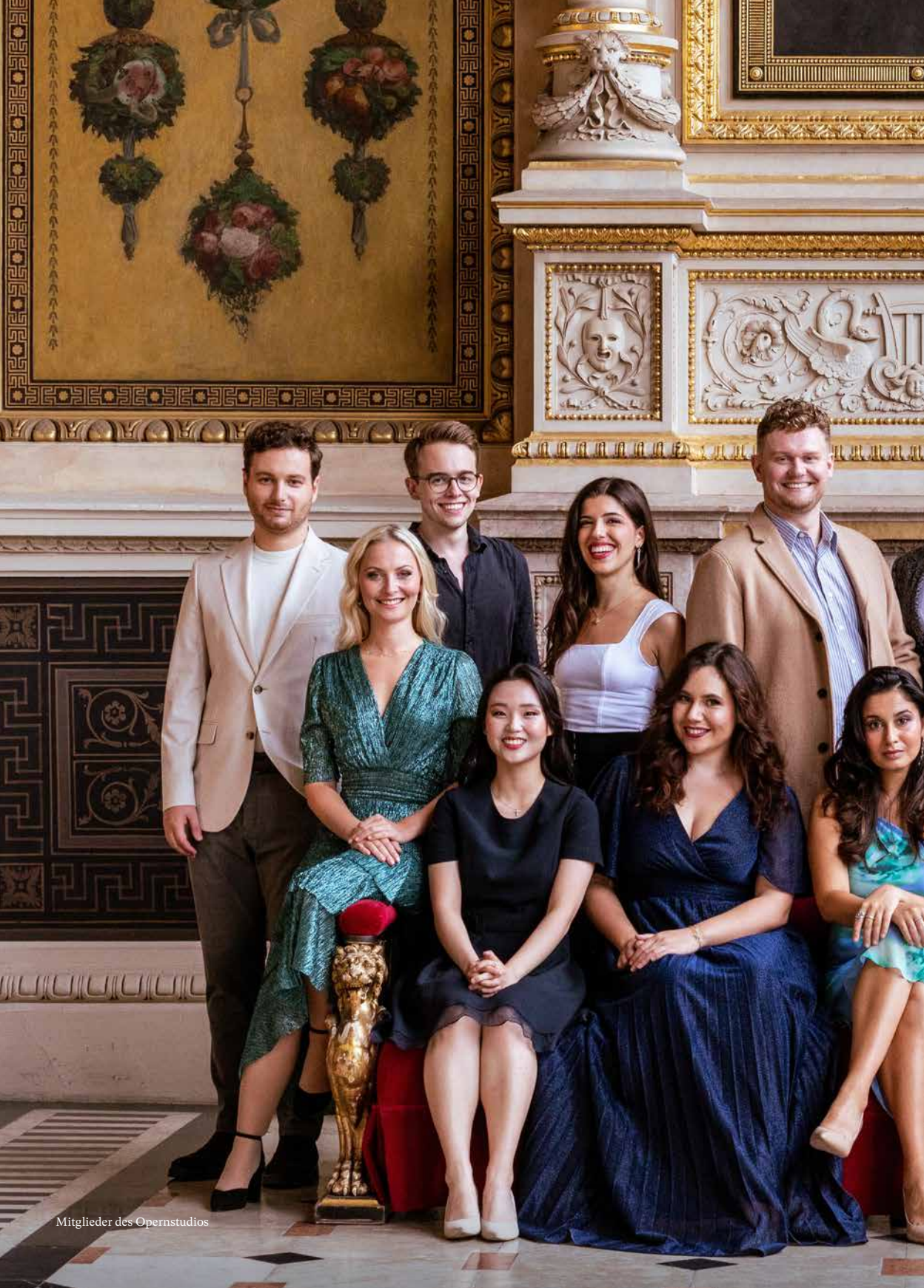
Mitglieder des Opernstudios