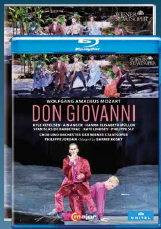
WOLFGANG AMADEUS MOZART DON GIOVANNI conducted by Philippe Jordan staged by Barrie Kosky